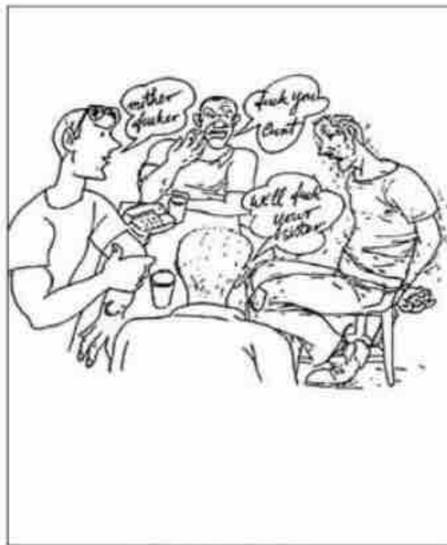
Humiliation during interrogation

تعذيباً بحسب التعريف الوارد في المادة 1 من الاتفاقية (43) ، ففي التقرير السنوي الذي صدر في السنة ذاتها عن لجنة حقوق الإنسان، استنتج المقرر الخاص للأمم المتحدة بشأن التعذيب، السيد نايجل رودلي، وهو من الخبراء في هذا المجال، أن التكتيكات التي تتبعها إسرائيل في التحقيقات "يمكن وصفها فقط على أنها تعذيب". ووجد رودلي أنه لو كان استخدام هذه التكتيكات بصفة منفصلة (أي واحد من التكتيكات في المرة الواحدة) "قد لا يتسبب بألم شديد، أو معاناة شديدة، إلا أن استخدامها معاً - وكثيراً ما تستخدم معاً - يمكن أن يثير هذا الألم والمعاناة بالذات، خصوصاً إذا ما تم تطبيقها على مدة ممتدة، لعدة ساعات على سبيل المثال. في الواقع، يبدو أنه تم استخدامها لعدة أيام، أو حتى أسابيع في بعض الحالات" (44) وأشارت منظمة بتسيلم أن "إسرائيل لم تتمكن حتى من إقناع مسؤول دولي واحد أو هيئة دولية واحدة بأن هذه الأساليب لا تشكل تعذيباً أو إساءة معاملة". بل إنها استشهدت باستطلاع للرأي العام جرى عام 1998، ووجد أن 67 بالمئة من الجمهور الإسرائيلي يعتقدون أن هذه الأساليب تشكل تعذيباً (45) . وأخيراً، يمتدح ديرشويتس قراراً صدر عن المحكمة الإسرائيلية العليا بشأن التعذيب، وشكل نقطة تحول، ويستنتج القرار أن تكتيكات التحقيقات التي تستخدم ضد المحتجزين الفلسطينيين "تزيد الألم والمعاناة" (46) .