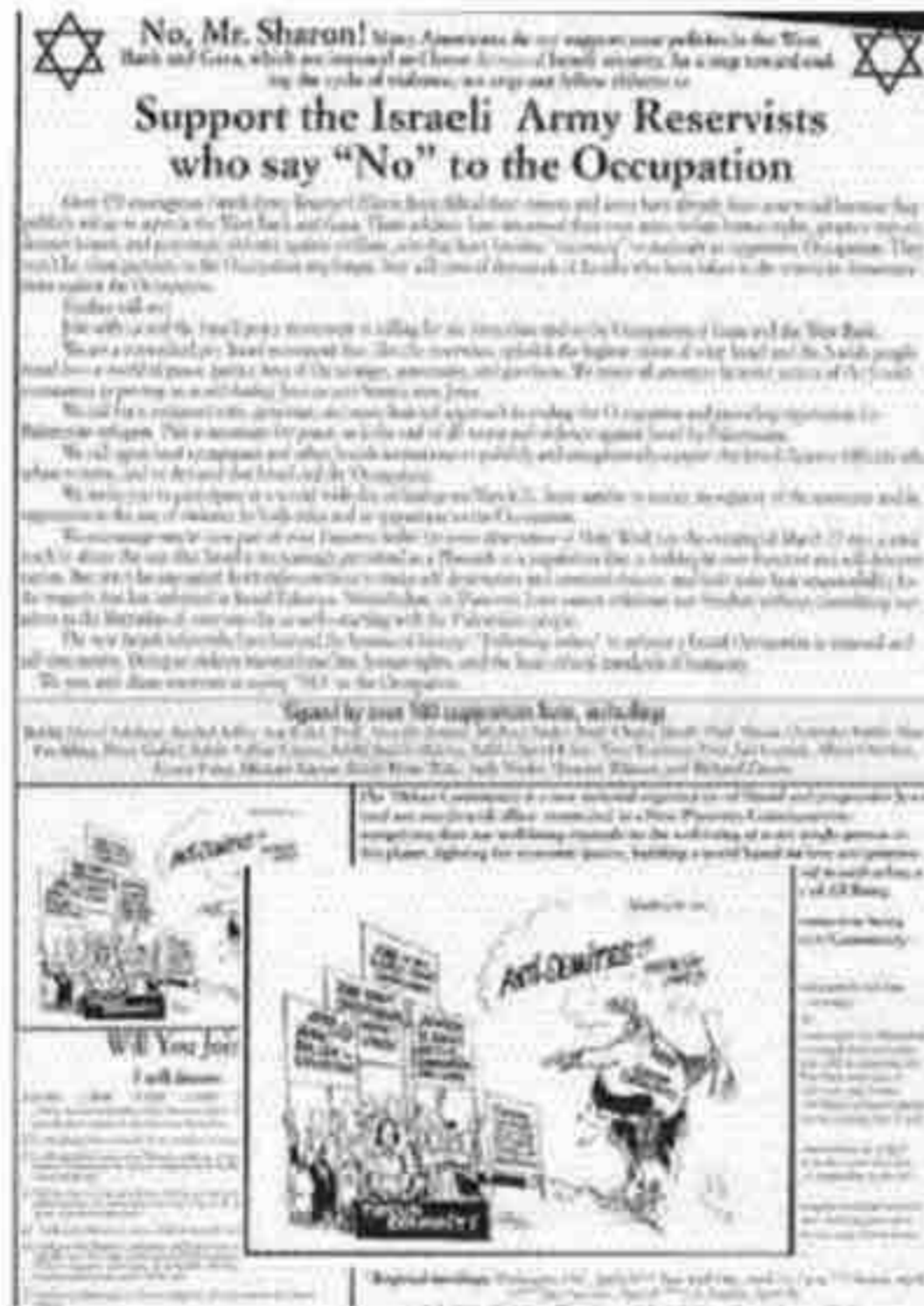
شكل 2: "أحد أنماط اللاسامية التقليدية". من مجلة تاكون.

ولقد أشرف فوكسمان على عملية التجسس واسعة النطاق المرتبطة بالاستخبارات الإسرائيلية، ونظام العزل العنصري في جنوب إفريقيا، وبعدهما حصل على مبلغ مالي من مارك ريتش - ملياردير تجارة السلع الذي فر إلى سويسرا قبل مثوله أمام المحكمة، بسبب إحدى وخمسين تهمة تتضمن التهرب من الضرائب، والاحتيال، وانتهاك العقوبات الاقتصادية المفروضة على إيران - تمت مساعدته على تأمين عفو رئاسي في أثناء الساعات الأخيرة من رئاسة بيل كلينتون، وإنَّ كون هذا الرجل ما زال يمتلك مصداقية، لهو دلالة رهيبة على الثقافة السياسية المعاصرة في الولايات المتحدة (8) .