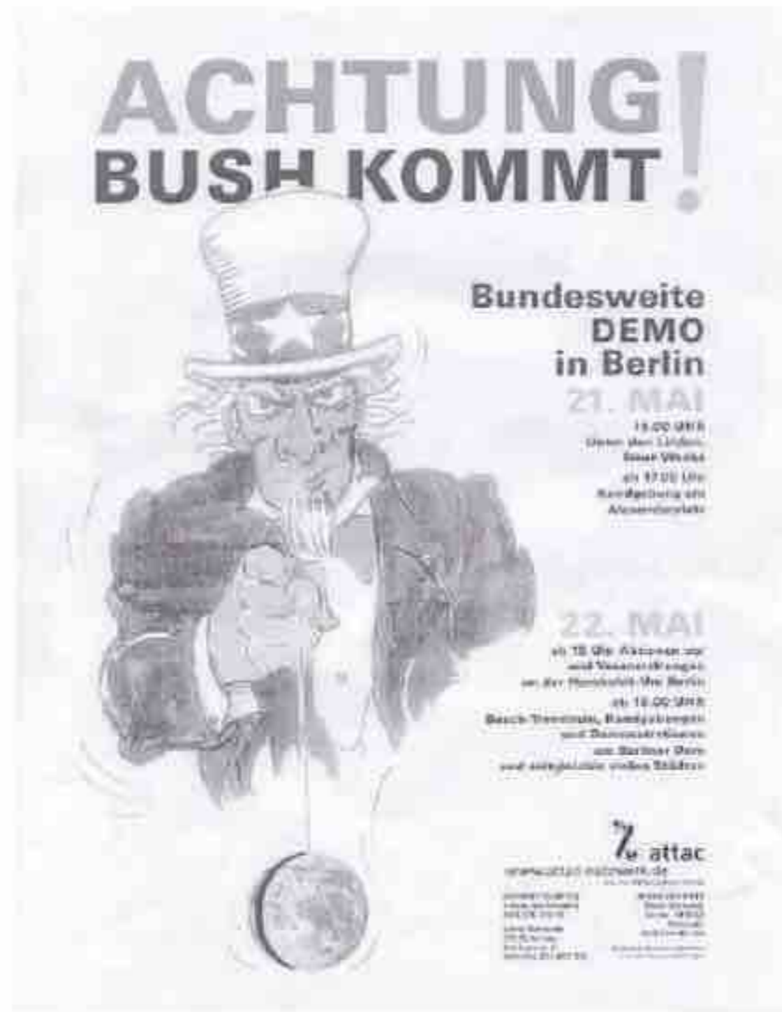
الشكل 1: حالة الأنف السامي المزعومة. تصميم أوتا إيكورث، برلين.

بعرض هذا الملصق على أشخاص عديدين، ولم ير أي منهم أنفا يهوديا في الصورة، ولندع جانبا أمر المؤامرة اليهودية، ومع ذلك أشار بعض من رأوا الملصق أنه يشبه ملامح الأفارقة الأمريكيين إلى حد ما، ومن الواضح أن مؤلفي تقرير "التجليات" بحاجة لمدة نقاهة طويلة، فقد لاحظ شوينفيلد لاسامية كلاسيكية" في إعلان أصدرته منظمة "تاكون" لمعارضة الاحتلال (انظر الشكل رقم 2). ألا تدل اللافتة التي تقول: "اليهود ليسوا معتدين، أو مستغلين"، مرفقا معها إشارة السلام، دليلا قاطعا على اللاسامية؟ (7) .